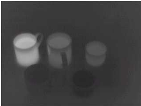
Fig.1 Infrared cup images containing different temperature water.

以上の事から、単純な赤外線可視化画像から各種機器の適正動作温度を前提とする高精度連続監視システム構築は困難である。