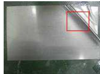
Fig.3 Silicon Steel Sheet with Bending at an Edge

鉄の欠損を想定し、歪みを持つ Fig.3 に示す珪素鋼板を用意する。歪み部分を平面ドーナツ状励磁磁コイル上に置き、誘導加熱した。加熱状態を赤外線画像として取り込み、Fig3 の赤枠部分の画素値分布をカラー表示した結果を Fig.4 に示す。赤部分が最も高温を示し、オレンジ色に近づくにつれ低温を示す。